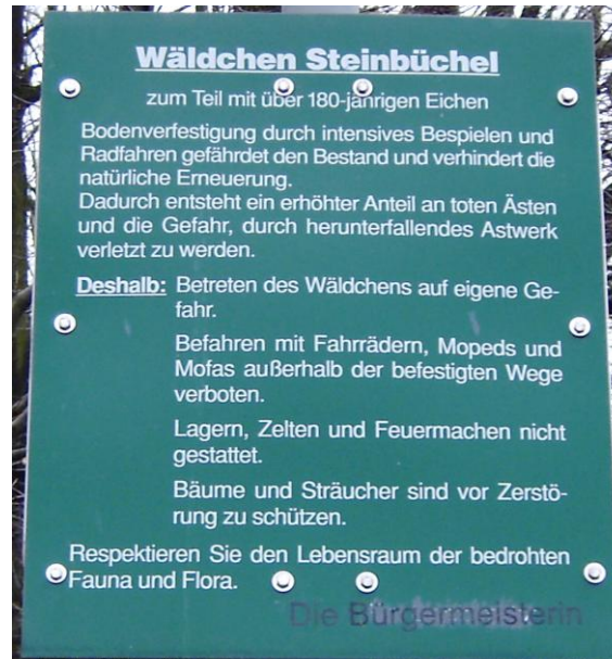
Schild an den Eingängen zum Wäldchen

Immer wieder hat es Versuche gegeben, das Merler Wäldchen zu bebauen. Die Stadt Meckenheim hat diesen Versuchen bisher eine klare Absage erteilt.