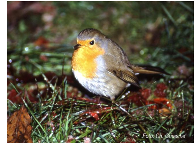
Rotkehlchen, ein Bewohner unseres Wäldchens

Völlig überraschend soll jetzt mitten im Merler Wäldchen ein Natur-/Bauspielplatz unter anderem mit Blockhütte, Seilbahn und Hochseilklettergarten errichtet werden – nachdem große Spielplätze direkt neben dem Wäldchen zu Bauland gemacht wurden.